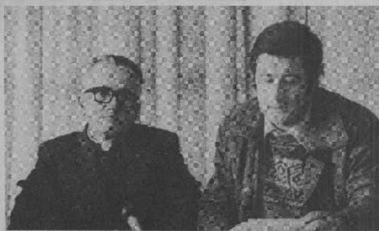
"Todo hombre tiene derecho a ser persona": un lema, aunque obvio, necesario hoy.

nosotros, expresó Mons. Ortúzar. "Filosóficamente no debiera decirse que todo hombre tiene derecho a ser persona, porque él es persona. Si lo hemos dicho de esa manera es simplemente porque para muchos desgraciadamente el hombre no es persona y no se le trata como tal".