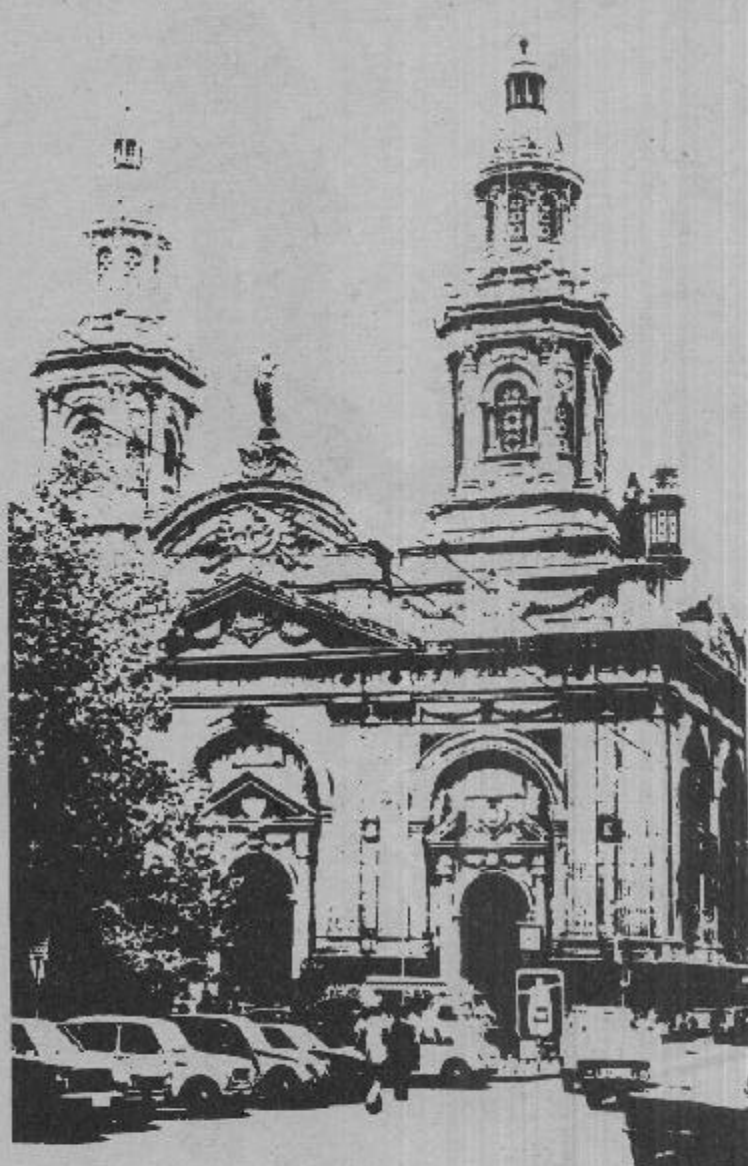
Catedral: lugar de encuentro de hombres que luchan en favor de los derechos de sus hermanos.

jante, que lo sienta como un hermano, estará espiritualmente presente en esta ocasión. El mundo entero estará en la Catedral: Asia, Africa, América, Europa. En cada rincón del mundo hay hombres que alzan su voz para defender a su hermano sumido en la pobreza, en la injusticia o en la opresión.