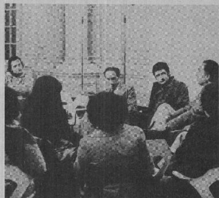
Una reunión de artistas plásticos