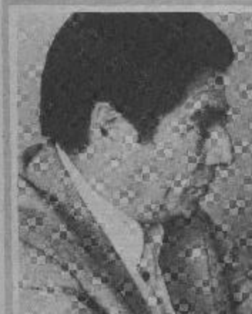
"Hay un profundo deterioro del proceso político. La democracia no existe en Chile".

En su grupo, no tienen libertad. "Ni para trabajar ni divulgar nuestras labores y ya a ser así mientras se mantenga el estado de emergencia porque hay que someterse a las normas restrictivas de las libertades públicas, lo que nos impide hacer una difusión de nuestros acuerdos, el realizar diálogos internos como el plenario que no fue autorizado, y se nos impide estar en contacto con organizaciones sociales y políticas. Nuestro trabajo, sin difusión, sin que las organizaciones lo tomen como alternativa, es superestructural; de manera que vamos a insistir en realizar asambleas plenarios y en divulgarlos por todos los medios que tengamos".