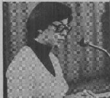
(Representante de la mujer) "Te ofrecemos, Señor, nuestra tristeza".

● INCORPORACION DEL TEMA DE LOS DERECHOS HUMANOS A JORNADAS ORDINARIAS DE DIOCESIS DE PROVINCIAS