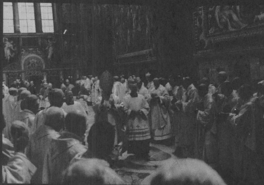
Gobernará junto a los cardenales y episcopados locales.

En el acto de inauguración del Pontificado de Juan Pablo II asistieron dignatarios de 102 países y 300 mil personas. En esa ocasión el Papa se dirigió al mundo en 11 idiomas proporcionando un signo de su futura gestión: su acercamiento a los hombres de todas las regiones del mundo . La