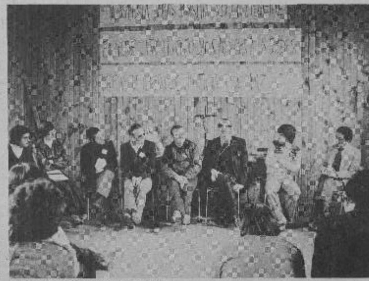
Derechos Humanos: reflexión en la base.

Todas las actividades de las zonas se han caracterizado porque en ellas han participado masivamente gente de los más diversos sectores. En la reflexión en torno a sus derechos y deberes, sin tener nada que ocultar, y sí mucho que decir, se han dado cuenta de la fuerza que les da la unidad, elemento fundamental para la construcción de una sociedad libre de represión y de injusticias como la anunciada por Cristo y que a los hombres les corresponde edificar.