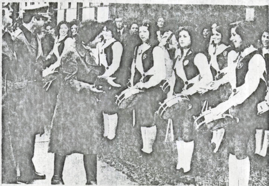
LA PRIMERA DAMA DE LA NACION, Lucía Hiriart de Pinochet, a su llegada a la ciudad de Puerto Montt. En el aeropuerto El Tepual, una banda femenina del Colegio Inmaculada Concepción saluda a la esposa del Presidente.