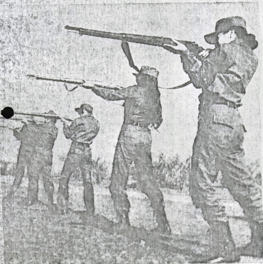
Intenso entrenamiento recibe el cuadro femenino permanente del Ejército. Mujeres del Batallón de Telecomunicaciones de Valparaíso mostraron su excelente preparación y eficiencia en las prácticas de tiro.

Es como si sobre sus cabezas flotara —después de casi un siglo— la sombra legendaria y heroica de la Sargento Candelaria. Sobre las arenas del desierto, bajo las lluvias sureñas o frente a las aguas del Pacífico, las mujeres están probando que llegado el momento también pueden ser un soldado para Chile.