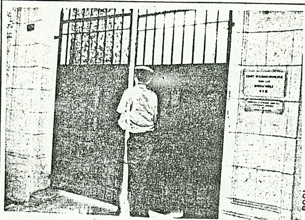
El edificio del Comité Intergubernamental de Migraciones.