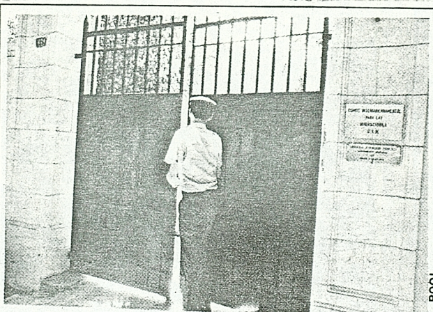
El edificio del Comité Intergubernamental de Migraciones.