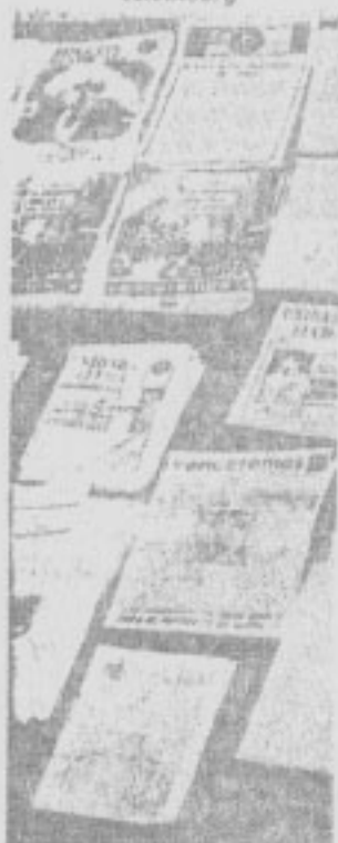
Panfletos y documentos que repartía el sacerdote Klomberg, presentados por la Fiscalía Militar