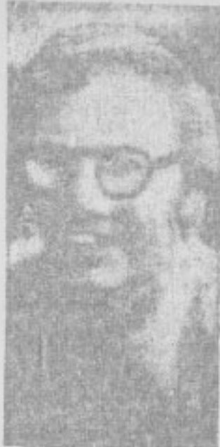
Sacerdote holandés Teodoro Klomberg