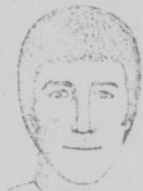
Retrato hablado sobre el "otro aspecto" de Andrés Pascal Allende

Por otra parte, se estableció que Pascal Allende se sometió a una cirugía estética en las orejas y tiene el pelo teñido de color castaño y usa un corte de pelo con chasquilla. Físicamente se le describe como de torax pequeño, un metro 85, piernas y brazos largos y con un hombro caído.