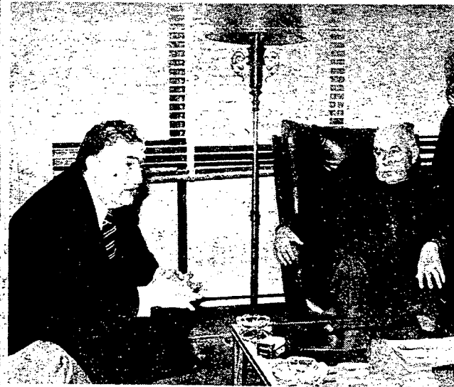
LA ENTREVISTA entre el Cardenal Silva Henríquez, acompañado de los vicarios Juan de Castro y el obispo Manuel Camilo Vial, con los ministros Sergio Badiola y Jaime Estrada, fue cordial y positiva al tenor de las declaraciones de estos personeros. EN LA FOTOGRAFIA, el Ministro Estrada junto al Cardenal.

Finalizó el Cardenal señalando que así como los pájaros tienen nidos, y algunos animales cuevas donde hacer crecer sus familias, el hombre necesita de una vivienda para poder desarrollarse conforme a su dignidad de Hijo de Dios.