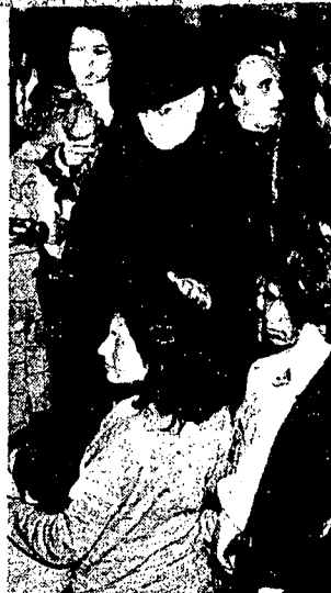
EL CARDENAL Raúl Silva Henríquez visitó ayer por la tarde a los pobladores. Se emocionó por la situación de 300 personas.

Luego agregó: "No tenemos intención política. No tenemos otra posibilidad ni poder para hacer otra cosa que estar junto con los pobres para hacerles presente a las autoridades que nos quieran oír la necesidad de atender este problema, para que se