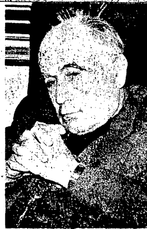
CARDENAL Silva Henríquez: "Se debe reconocer que el problema no es nuevo".