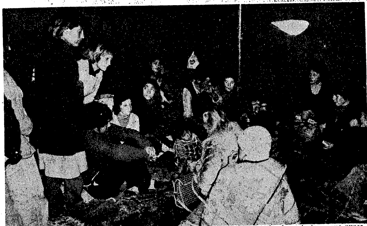
Parejas jóvenes, padres de familias pequeñas, familias que nacieron bajo el techo de parientes y que nunca se han enfrentado seriamente con el mundo del trabajo y de la capacitación, constituyen mayoría en esta "toma" de La Bandera