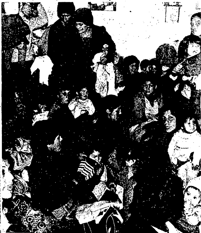
DRAMATICO ES EL ESTADO en que se encuentran los pobladores desalojados.

busque una solución o un principio de solución".