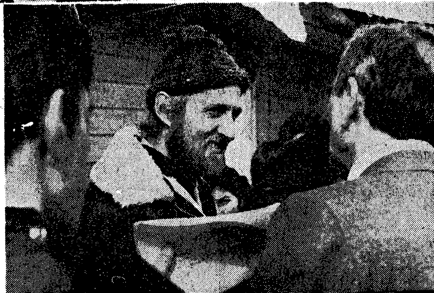
Un clima de gran tranquilidad se observaba ayer entre las aproximadamente 300 personas que, para exigir solución a su problema habitacional, mantienen ocupada una capilla y el sitio correspondiente en la población La Bandera. En la foto superior, pobladoras preparan el almuerzo para sus respectivas familias. En el grabado inferior, un sacerdote canadiense, quien en un principio se negó a identificarse y a explicar su presencia en el lugar