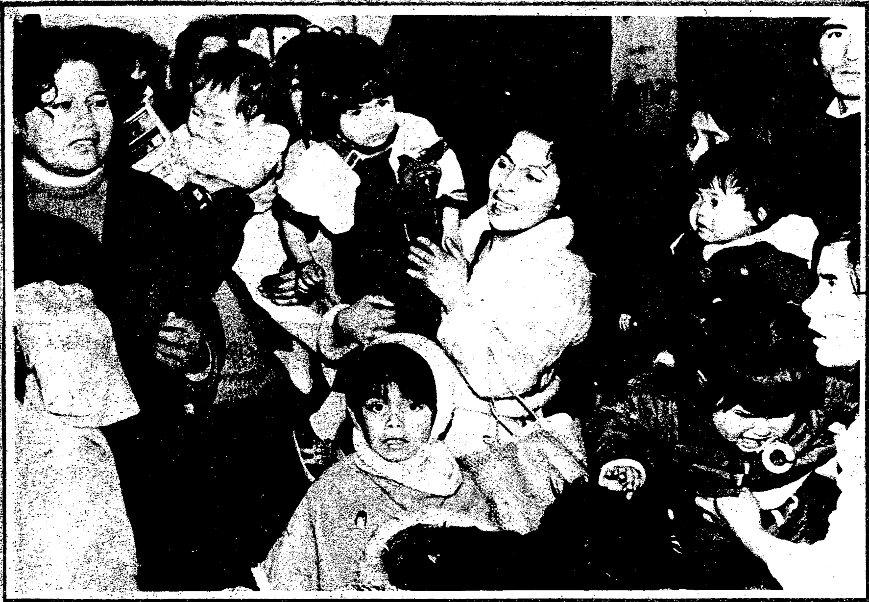
Había niños por todas partes en La Bandera. Los ocupantes ilegales se rodearon de pequeñuelos quizás para enfriar la acción política. Todo estaba plantificado.