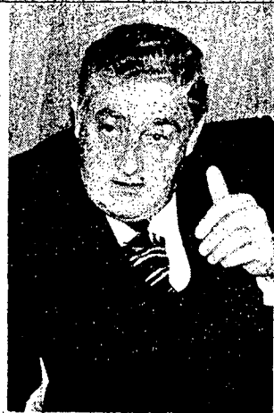
HAY UNA TENDENCIA de crecimiento de la construcción, y este año se congeló el déficit habitacional, sostuvo el Ministro Estrada.