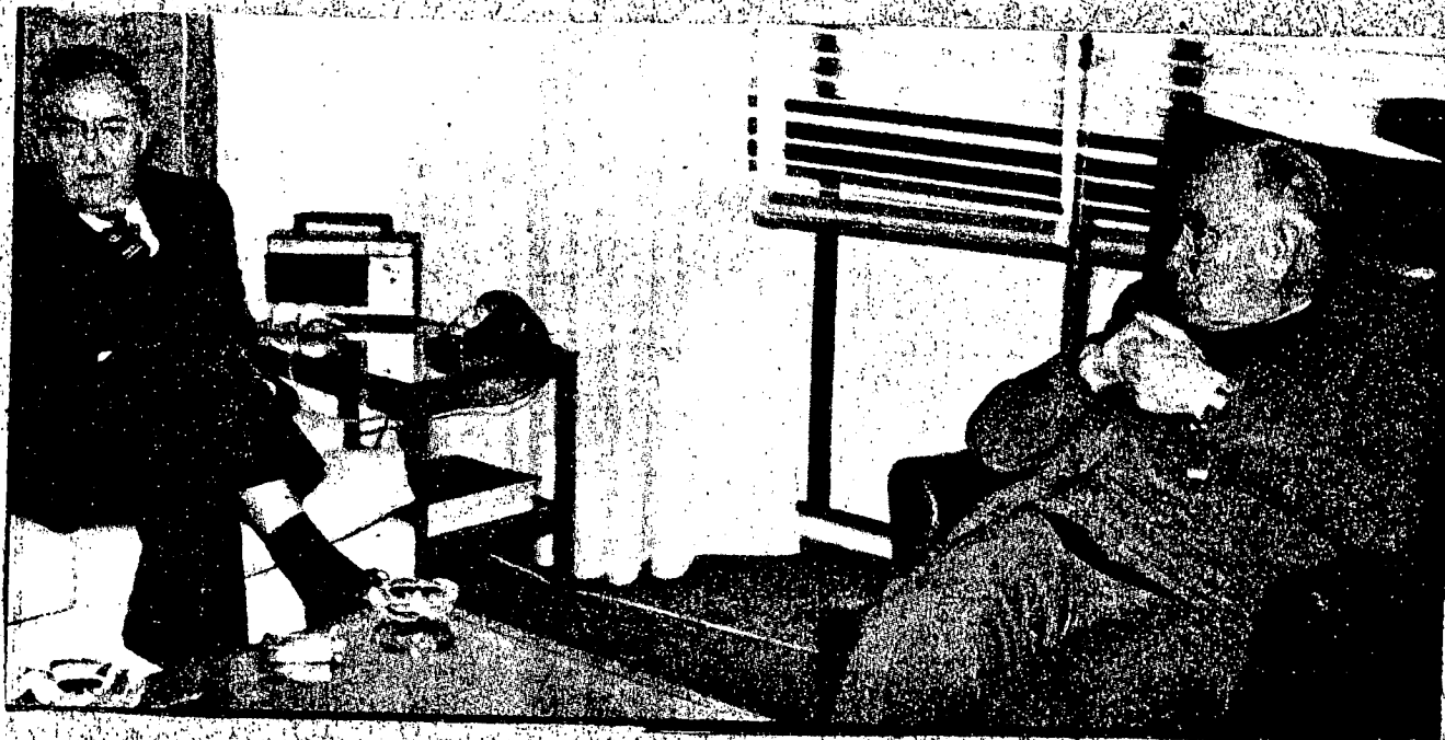
AL LADO, el Cardenal Silva Henríquez y el Ministro de la Vivienda Jaime Estrada, se reunieron para buscar solución a los "sin casa".