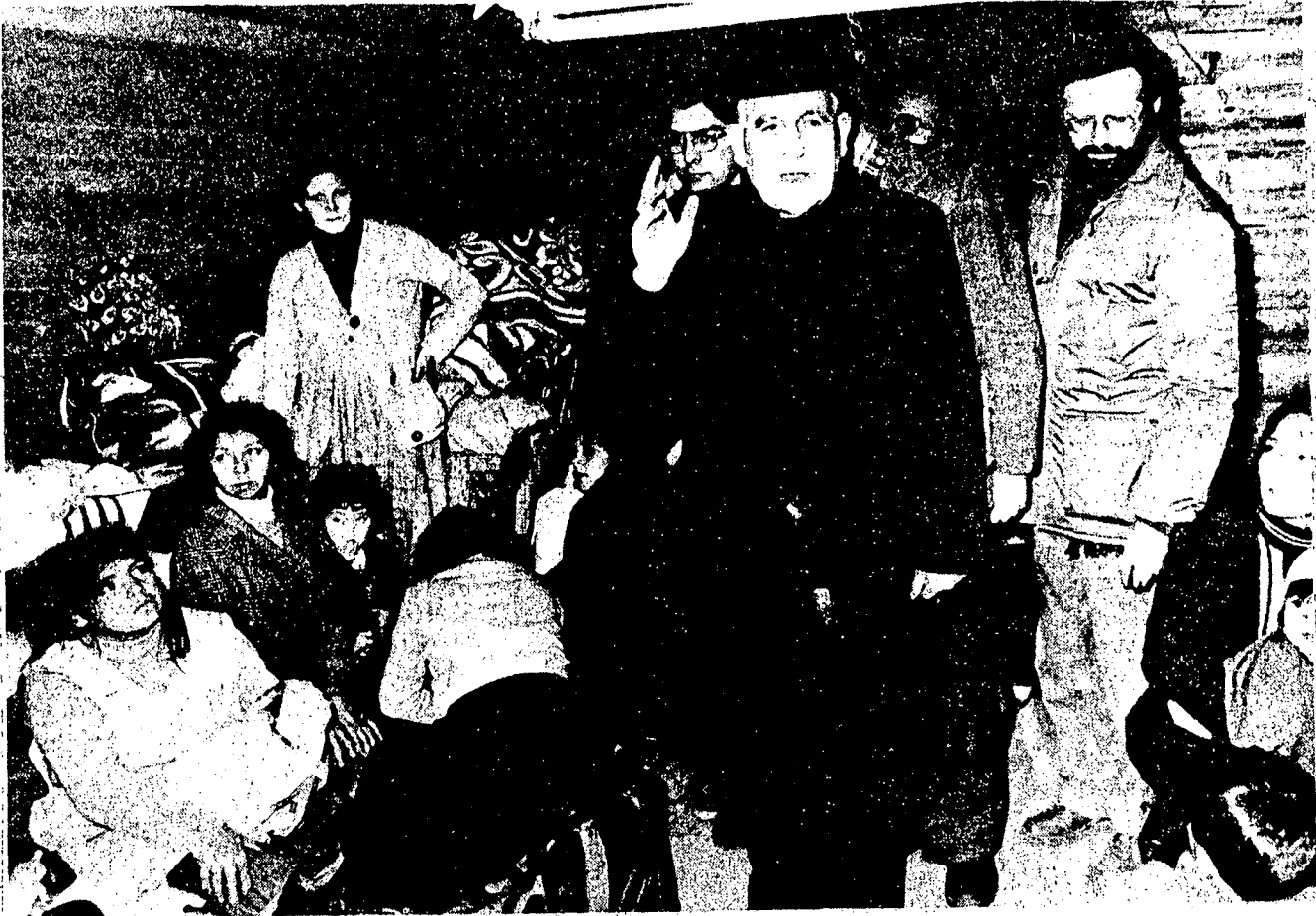
El Cardenal Raúl Silva Henríquez procedió a dar su bendición a las 300 personas que permanecen en el interior de la capilla de la Iglesia Católica en Santa Rosa.